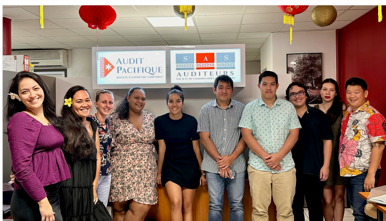
Une partie des collaborateurs d'Audit Pacifique, tous des anciens étudiants du DCG !

Par ailleurs, Audit Pacifique compte, parmi ses 30 collaborateurs, un tiers d'anciens étudiants du DCG !